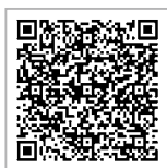
日発健保契約健診機関

※ QRコードに記載の日発健保健診機関リストで 受診できない方はP3に記載の集合契約健診を利用できます。